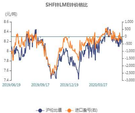
图1：锌两市比值走势图