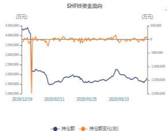
图4：期锌持仓资金走势图