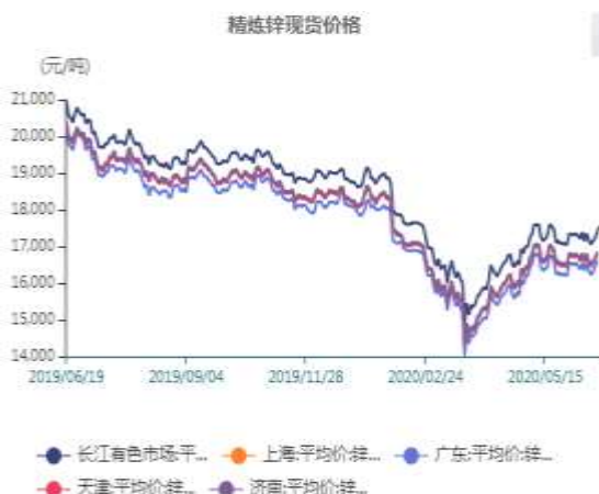
图8、国内锌锭价格走势图

截止至2020年06月19日，长江有色市场0#锌平均价为17550元/吨；上海、广东、天津、济南四地现货价格分别为16850元/吨、16610元/吨、16800元/吨