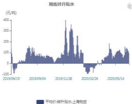
图10: 上海精炼锌贴水走势图