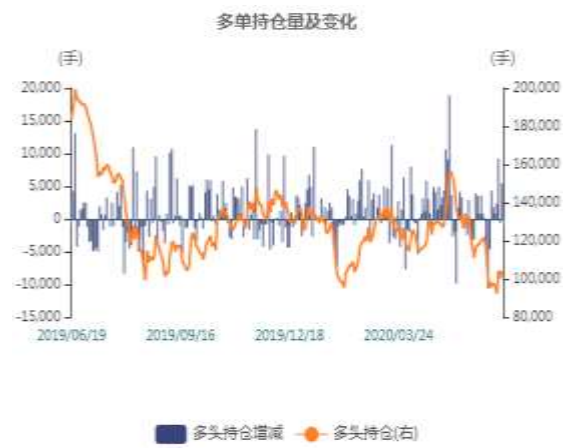
图2：沪锌多头持仓走势图