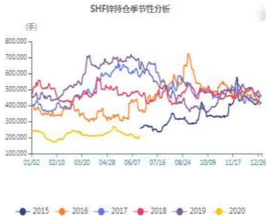
图5：沪锌季节性持仓走势图