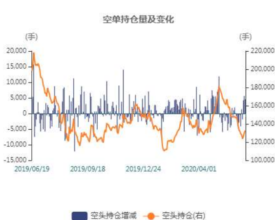
图3：沪锌空头持仓走势图