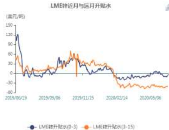
图11: LME锌现货升水走势图

截止至2020年06月18日，LME近月与3月价差报价为-5.25美元/吨，3月与15月价差报价为贴水39.25美元/吨