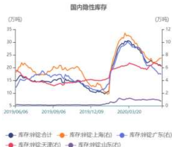
图16: 国内隐性库存走势图