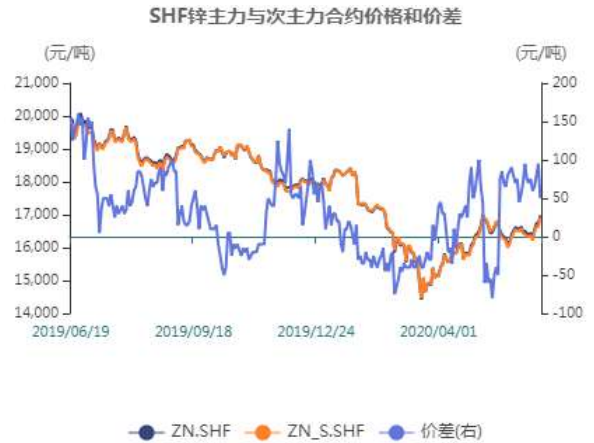
图6：沪锌主力与次主力价差走势图