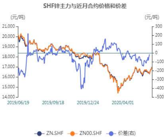
图7：沪锌近月与远月价差走势图