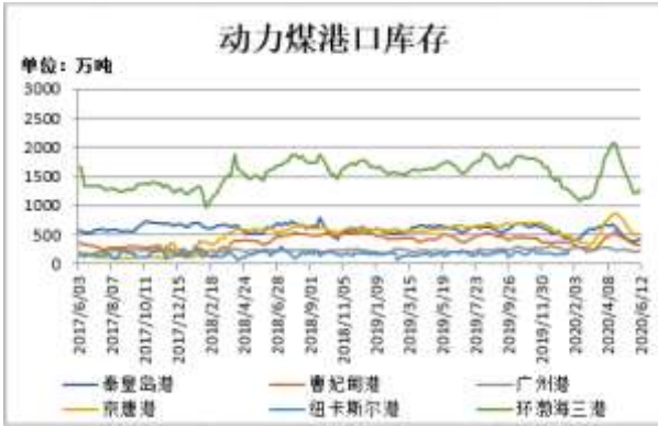
图7：动力煤港口库存

截至6月12日，动力煤港口库存：环渤海三港(秦皇岛港、曹妃甸港、京唐港)港口库存 1260.4 万吨，环比前一周增 35.8 吨；其中秦皇岛港库存 435 万吨，比前一周增 43 万吨；曹妃甸港库存 314.1 万吨，比前一周减 15.2 万吨；京唐港库存 511.3 万吨，比前一周增 8 万吨。广州港库存 239.7 万吨，比前一周增 24.8 万吨。