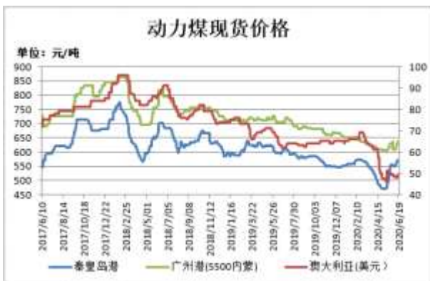
图1：动力煤现货价格

截止 6 月 19 日，秦皇岛港山西优混（Q5500V28S0.5）平仓含税价报 570 元/吨，较上周涨 8 元/吨；广州港内蒙优混 Q5500，V24，S0.5 港提含税价 635 元/吨，较上周涨 15 元/吨；澳大利亚动力煤（Q5500,A<22,V>25,S<1,MT10）CFR（不含税）报 49 美元/吨，较前一周涨 1 美元/吨。