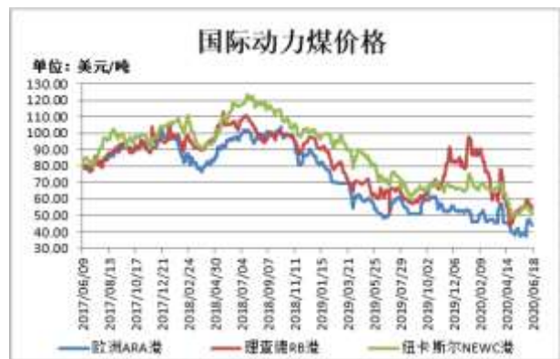
图2：国际动力煤现货价格

截止 6 月 18 日，欧洲 ARA 港动力煤现货价格报 44.38 美元/吨，较前一周跌 1.62 美元/吨；理查德 RB 动力煤现货价格报 54.42 美元/吨，较前一周跌 1.22 美元/吨；纽卡斯尔 NEWC 动力煤现货价格报 50.5 美元/吨，较前一周跌 2.31 美元/吨。