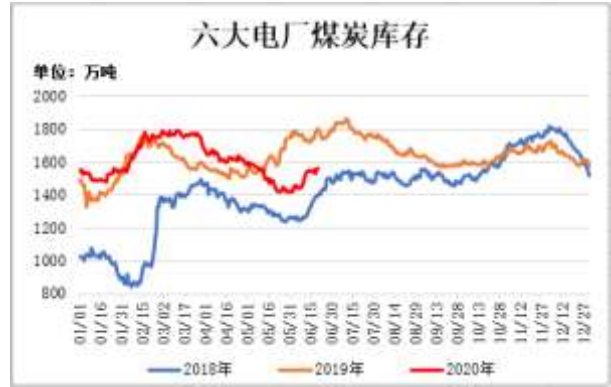
图8：六大电厂煤炭库存

截止6月19日，六大电厂煤炭库存为 1562.72 万吨，较前一周增加 14.93 万吨。