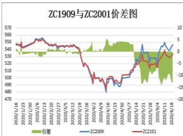
图5：郑煤期货跨期价差

截止6月19日，期货ZC2009与ZC2101（远月-近月）价差为-12.8元/吨，较前一周跌0.6元/吨。