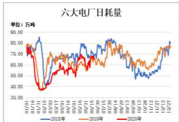
图10：六大电厂日均耗煤量

截止6月19日，六大电厂煤炭库存可用天数 23.32 天，较前一周减少 0.15 天。