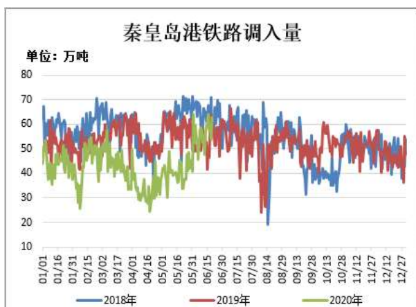
图11: 秦皇岛港铁路调入量

截止 6 月 19 日, 秦皇岛港铁路调入量为 62.6 万吨, 较前一周增 5.5 万吨。