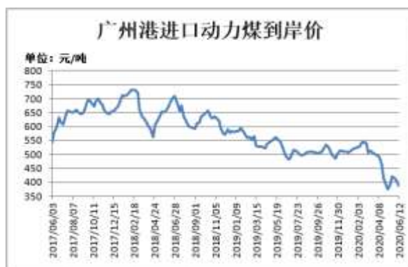
图14: 广州港进口动力煤到岸价

截止 6 月 12 日, CCTD 广州港进口动力煤 (Q5500) 到岸价 388 元/吨, 较前一周跌 14 元/吨。