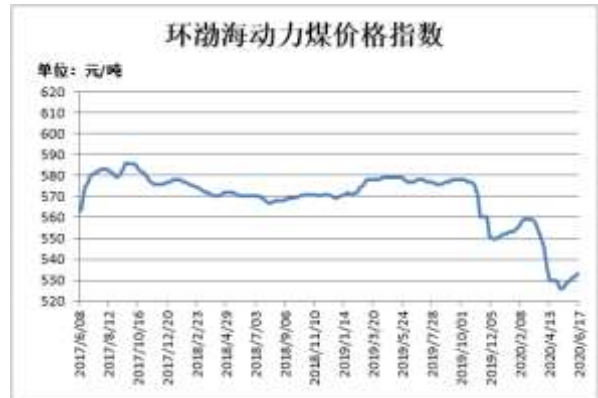
图4：环渤海动力煤价格指数

截止6月19日，郑煤期货主力合约收盘价546元/吨，较前一周涨1.2元/吨；郑煤期货主力合约持仓量141577手，较前一周减3736手。