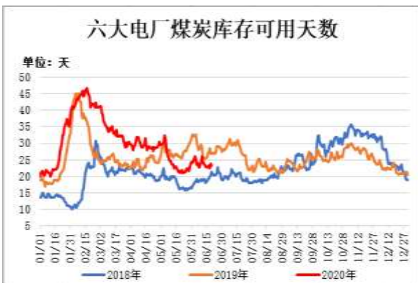
图9：六大电厂煤炭库存可用天数

截止6月19日，六大电厂煤炭库存可用天数 23.32 天，较前一周减少 0.15 天。