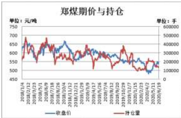
图3：郑煤期货价格与持仓量

截止6月19日，郑煤期货主力合约收盘价546元/吨，较前一周涨1.2元/吨；郑煤期货主力合约持仓量141577手，较前一周减3736手。