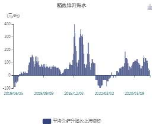
图10：上海精炼锌贴水走势图