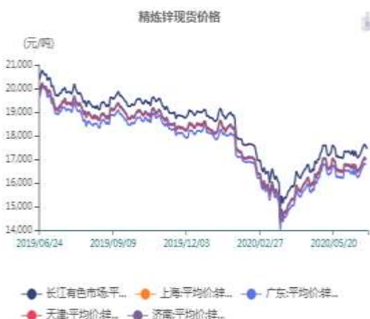
图8、国内锌锭价格走势

截止至2020年06月24日，长江有色市场0#锌平均价为17440元/吨；上海、广东、天津、济南四地现货价格分别为17000元/吨、16770元/吨、16950元/吨