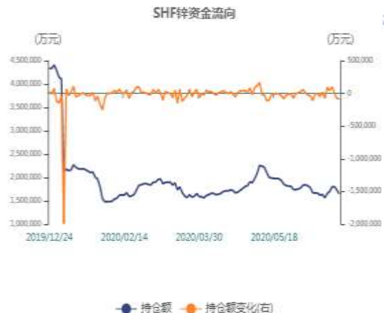
图4：期锌持仓资金走势图