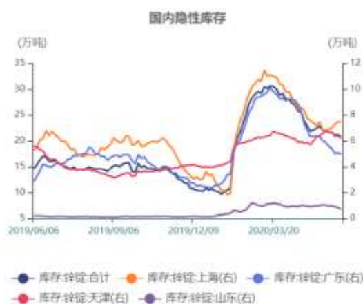
图16: 国内隐性库存走势图