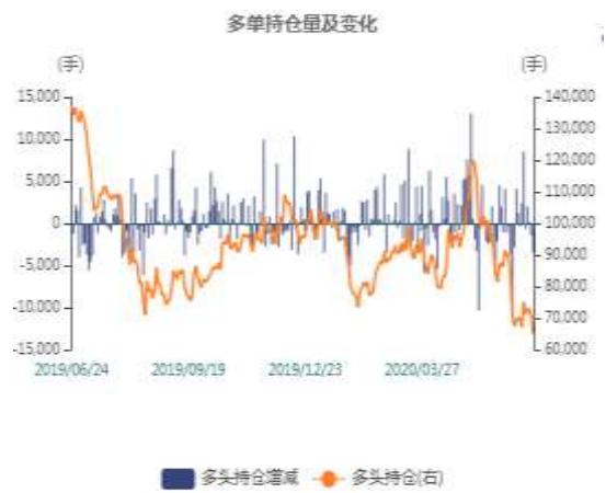
图2：沪锌多头持仓走势图