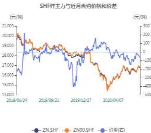
图7：沪锌近月与远月价差走势图