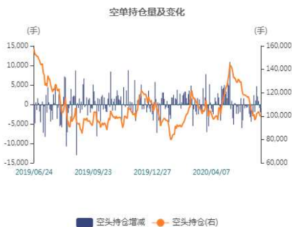
图3：沪锌空头持仓走势图