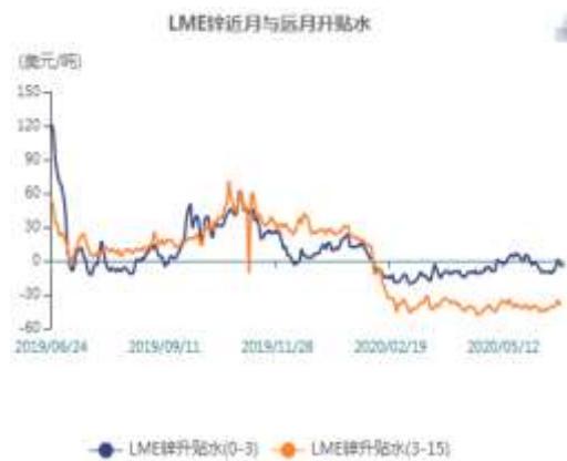
图11：LME锌现货升水走势图

截止至2020年06月23日，LME近月与3月价差报价为-5.75美元/吨，3月与15月价差报价为贴水39美元/吨