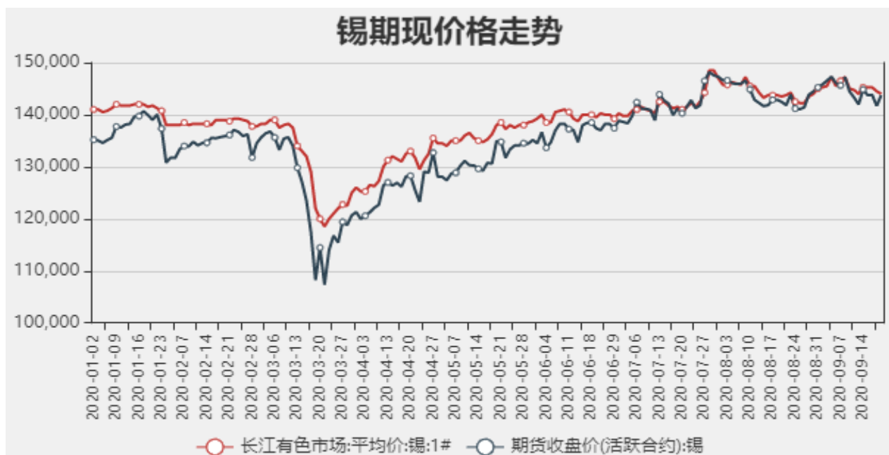
图1：国内锡现货价格

截止至2020年09月18日，长江有色市场1#锡平均价为144000元/吨，沪锡期货价格为143750元/吨。