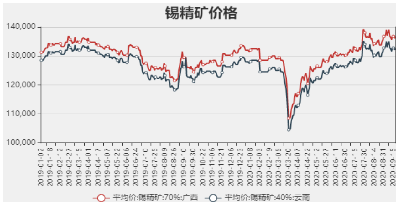
图2：国内锡精矿价格

截止至2020年09月17日，国内广西锡精矿70%价格为136000元/吨，云南锡精矿40%价格为132000元/吨。