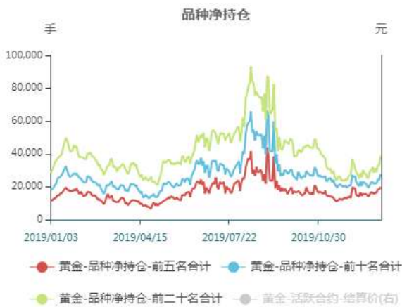
图5：黄金非商业净多持仓走势图