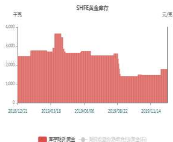
图19: 沪金仓单走势图