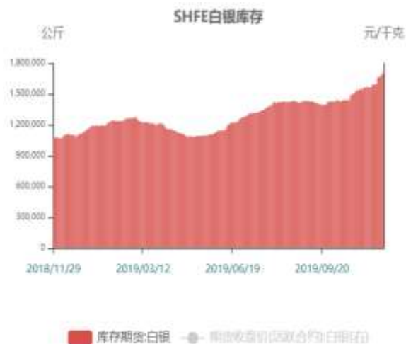
图20: 沪银仓单走势图