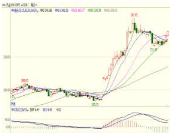
图1：沪金主力期货合约价格