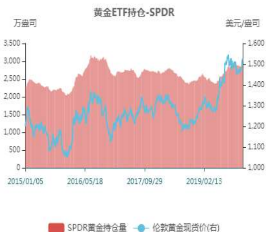
图9：国内黄金基差贴水走势图