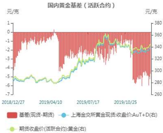
图11: 国内黄金跨期价差走势图