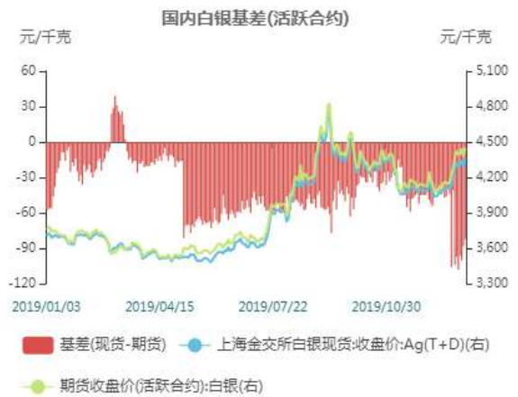
图12: 国内白银跨期价差走势图