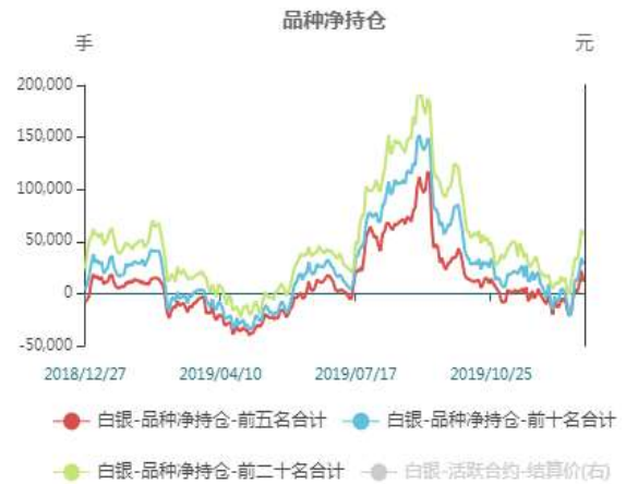
图6：白银期货非商业净多持仓走势图