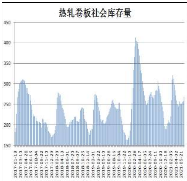
图10：全国33城热卷社会库存

6月17日，据Mysteel监测的全国33个主要城市社会库存为268.91万吨，较上周增加10.86万吨，较去年同期增加20.3万吨。