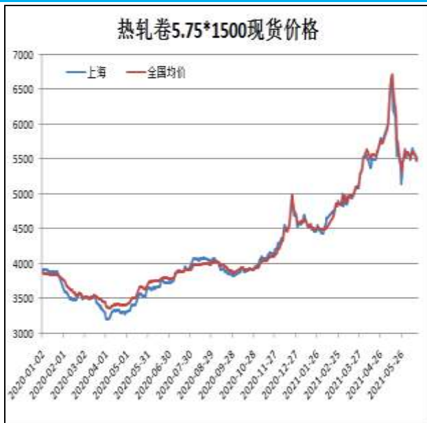
图1：热轧卷板现货价

6月18日，上海热轧卷板5.75mm Q235现货报价为5520元/吨，周环比-130元/吨；全国均价为5522元/吨，周环比-70元/吨。