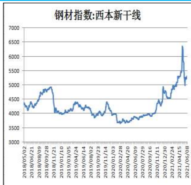
图2：西本新干线钢材价格指数

6月18日，上海热轧卷板5.75mm Q235现货报价为5520元/吨，周环比-130元/吨；全国均价为5522元/吨，周环比-70元/吨。