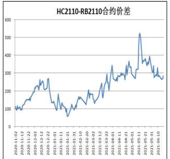
图6：热卷与螺纹跨品种套利

本周，HC2110合约走势弱于RB2110合约，18日价差为286元/吨，周环比-2元/吨。