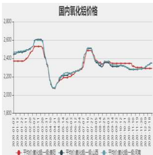
图3：国内氧化铝价格