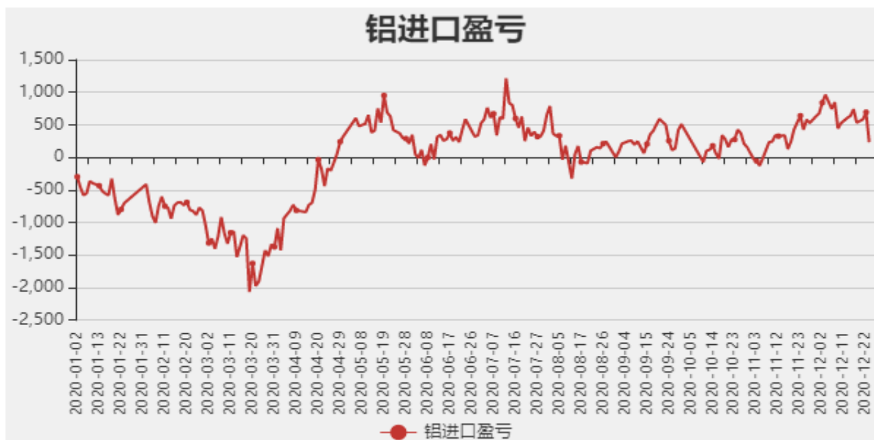
图5：铝进口利润和沪伦比值

截止至12月24日，贵阳氧化铝价格为2290元/吨；库存方面，截止至12月25日，国内总计库存为60.3万吨。