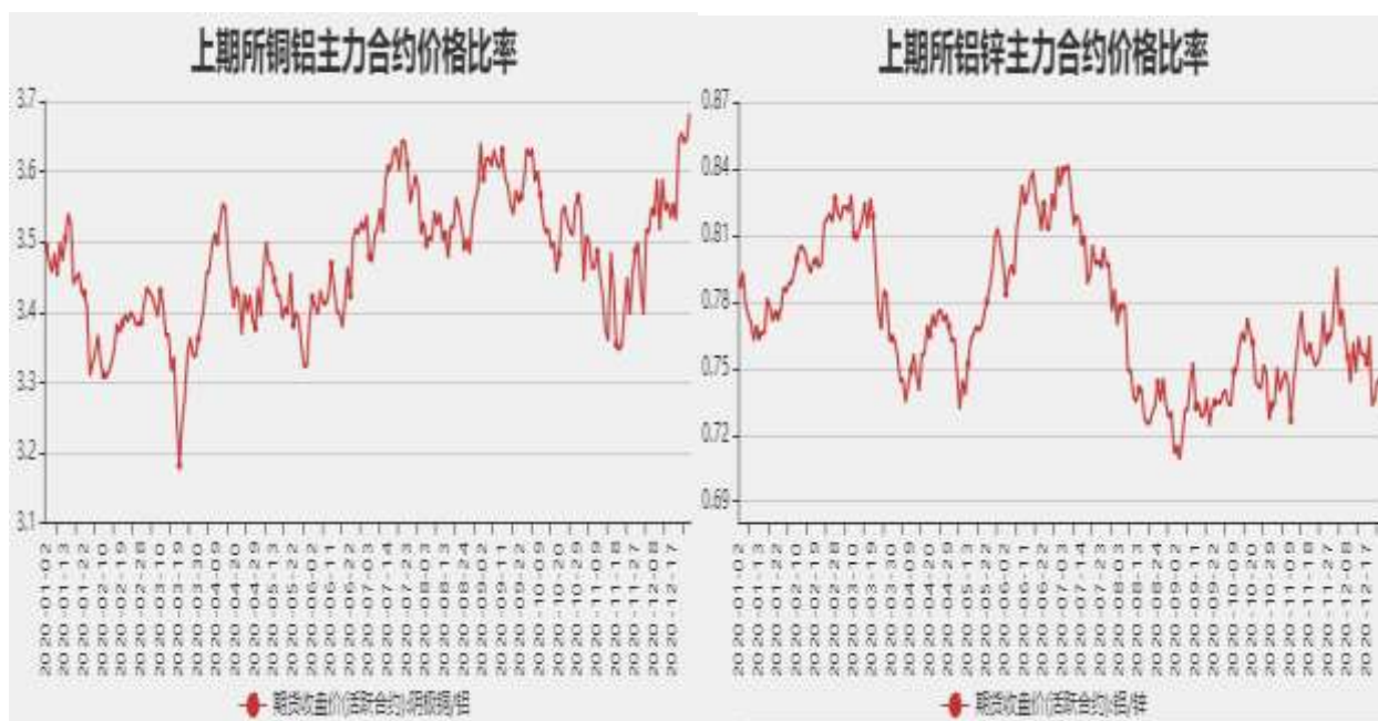
图14：沪铝与沪锌主力合约价格比率

截止至12月25日，铜铝以收盘价计算当前比价为3.6830，铝锌以收盘价计算当前比价为0.7322。