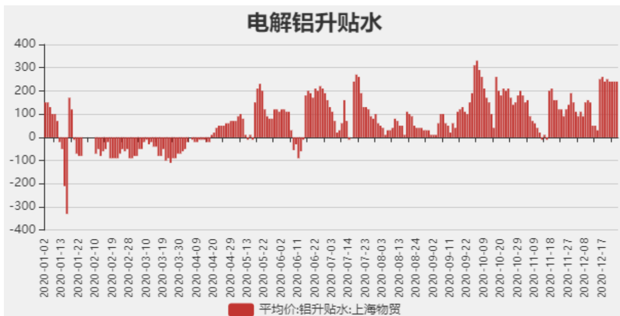
图2：电解铝升贴水走势图

截止至2020年12月25日，长江有色市场1#电解铝平均价为15900元/吨，沪铝期货价格为16310元/吨。