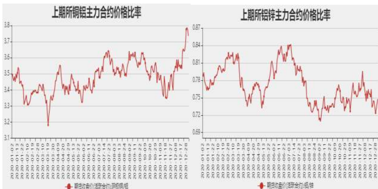
图14：沪铝与沪锌主力合约价格比率

截止至12月31日，铜铝以收盘价计算当前比价为3.7354，铝锌以收盘价计算当前比价为0.7478。