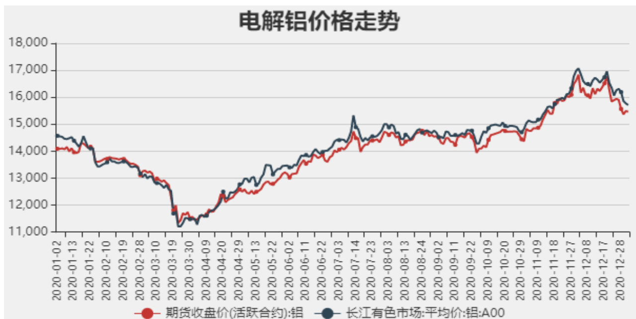
图1：电解铝期现价格

截止至2020年12月31日，长江有色市场1#电解铝平均价为15460元/吨，沪铝期货价格为15710元/吨。