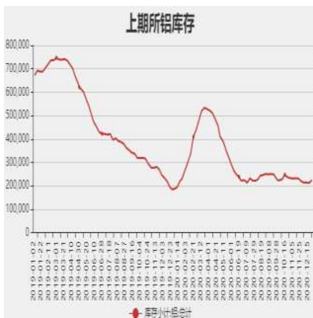
图8：上海期货交易所电解铝库存