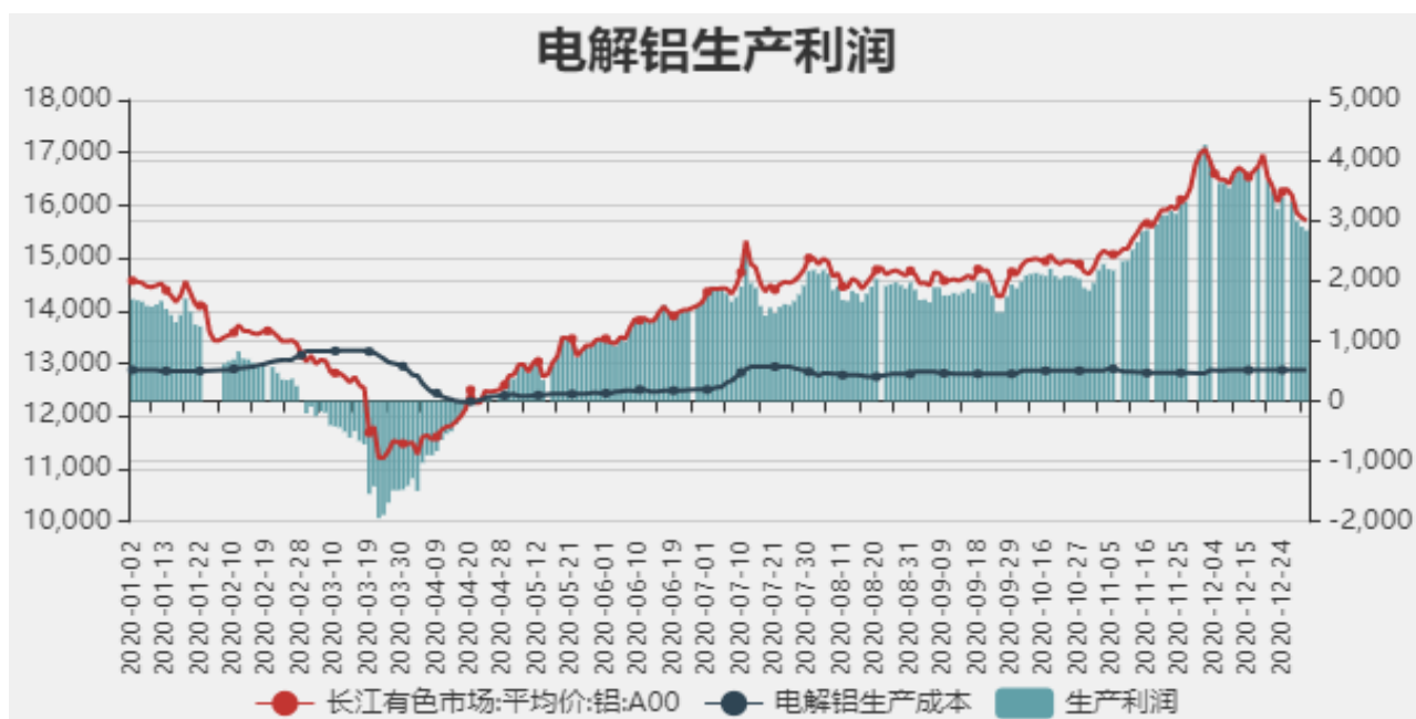
图11：电解铝生产利润