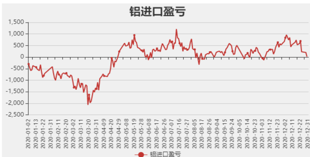
图5：铝进口利润和沪伦比值

截止至12月31日，贵阳氧化铝价格为2290元/吨；库存方面，截止至12月25日，国内总计库存为60.3万吨。