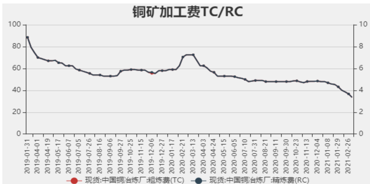
图2：中国铜冶炼加工费

2021年3月5日中国铜冶炼厂粗炼费（TC）为33.5美元/干吨，精炼费（RC）为3.35美分/磅，较上周下调3.2美元/干吨。