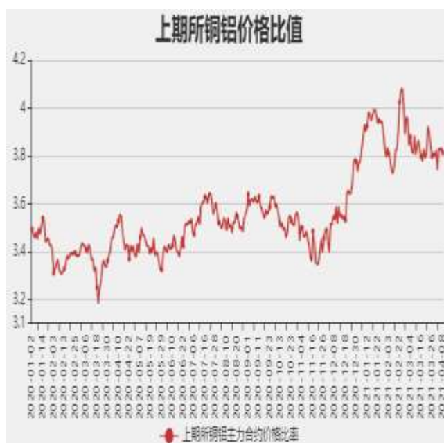
图9：沪铜和沪铝主力合约价格比率