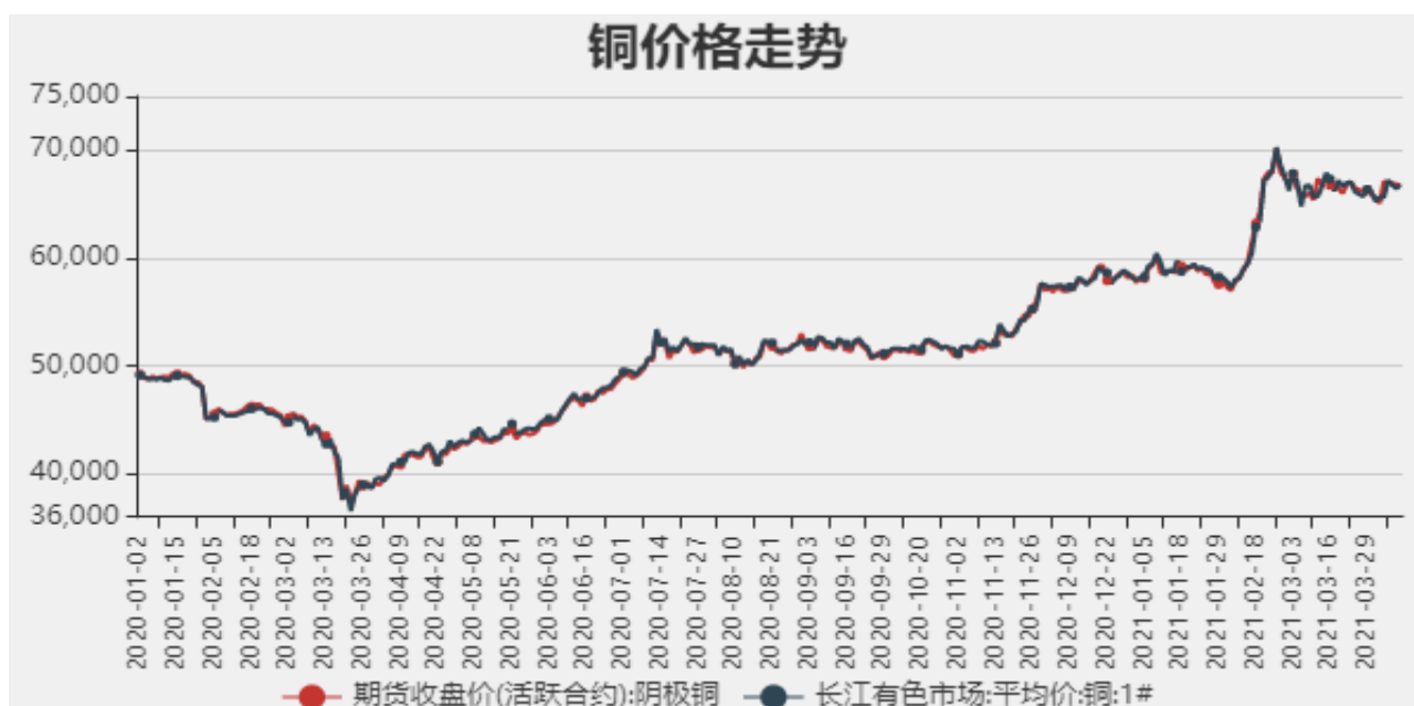
图1：铜期现价格走势

截止至2021年4月9日，长江有色市场1#电解铜平均价为66720元/吨；电解铜期货价格为66800元/吨。