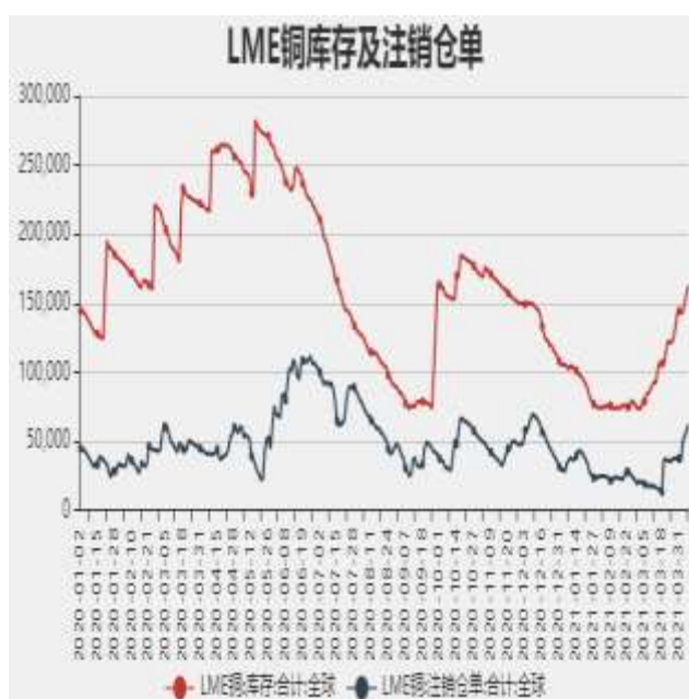
图7：LME铜库存及注销仓单