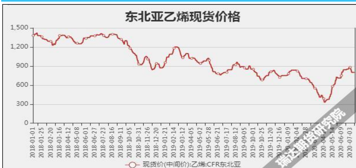
图13 东北亚乙烯现货价

截至8月12日当周, 内陆地区部分甲醇代表性企业库存量45万吨, 较上周+0.47万吨。