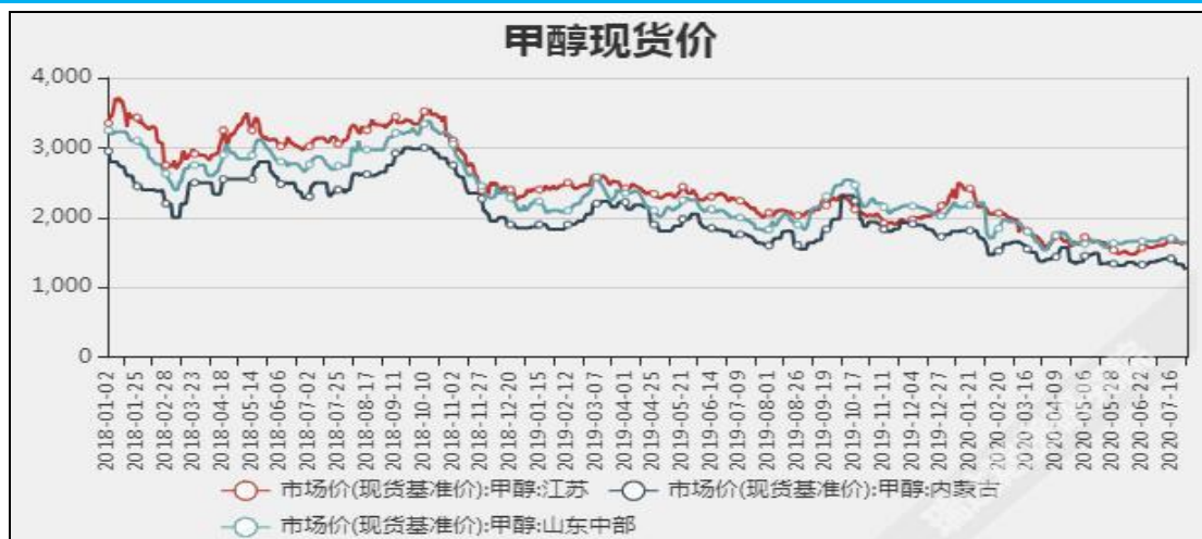
图3 甲醇现货市场主流价

截至8月13日，NYMEX天然气收盘价2.19美元/百万英热单位，较上周+0.03美元/百万英热单位。