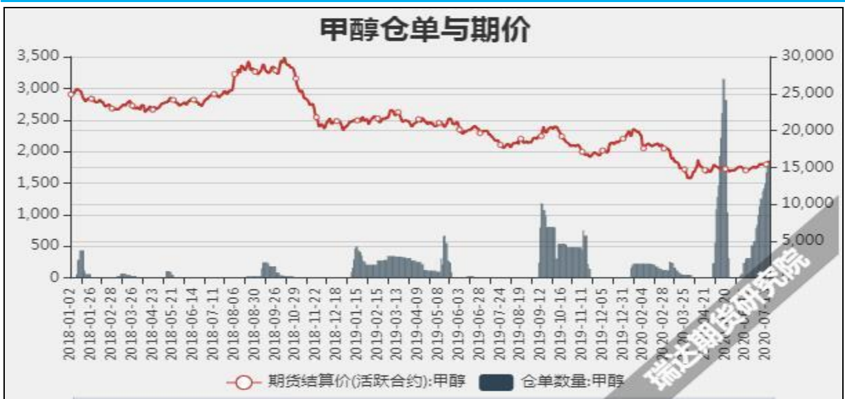
图7 甲醇期价与仓单数量