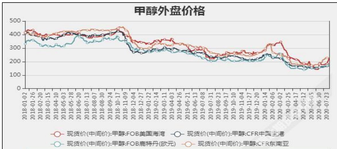
图5 外盘甲醇现货价格